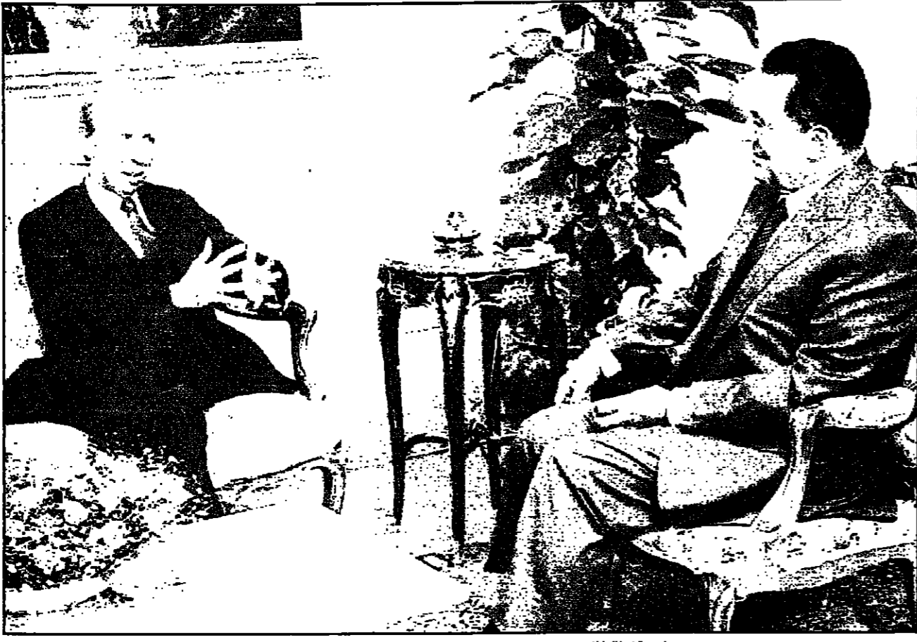
وفد خارجية إيطاليا لأميرتو ديني في شياطة الرئيس حسني مبارك نهار أمس في القاهرة